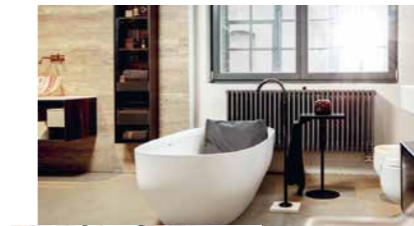
Ästhetik, Funktionalität und Komfort: Das Badesofa macht den Badespaß zuhause noch luxuriöser.