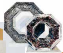
Das Gedankmaterial der Terroranschläge in Wien vom 2. November 2020 fand in den Oktagon Skulpturen einen Platz für die Ewigkeit.