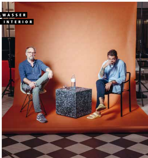
Die Design-Studios „Studio Spezial“ und „Dottings“ entwickelten für Mineralwasserabfüller Vöslauer zwei nachhaltige und schicke Wasser-Boxen.

Neue Entwürfe von kreativen Köpfen erobern die internationale Interior-Bühne und schlagen einen neuen Kurs ein, besinnen sich dabei gleichzeitig auf altes Handwerk und Langlebigkeit. Dem steht auch die heimische Architektur und Kunst-Branche nichts nach: Sie lädt zum Umdenken ein, wagt Neues, berührt und regt zum Nachdenken an. Kurzum: Auch 2021 ist voll mit Möbel, Trends und Ideen, die nur darauf warten, entdeckt zu werden - lassen Sie sich inspirieren!